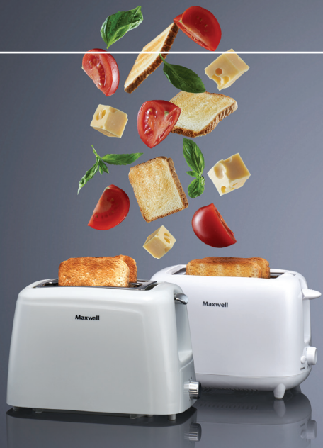
ТОСТЕР MAXWELL MW 1504 (код 526217)