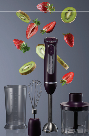
БЛЕНДЕР ВИТЕК 8535 (код 526216)