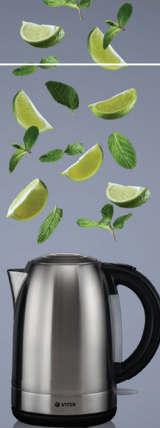
ЧАЙНИК ВИТЕК 7021 (код 526219)